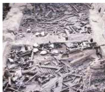
青谷上寺地遺跡 弥生時代の品々が出土した様子

青谷上寺地遺跡は、山陰道の道路建設工事に伴って発掘調査された弥生時代の集落の跡です。この遺跡を囲む溝の中からは、当時の暮らしに関わる品々が多数出土しました。精巧な木製品など、通常では朽ちて残らないようなものが出土しています。当時この地域は潟湖(ラグーン)が広がり、そのほとりの低湿地帯に人々が暮らしていました。水分を大量に含んだ低湿地帯の粘土層が、密閉された酸素のない環境をつくりだし、木材などの有機物が菌に分解されることを防ぎました。そのために保存状態の良い出土品が多数出土し、「地下の弥生博物館」とも呼ばれています。また、出土した弥生人の頭蓋骨の中から脳が発見され、話題になりました。先史時代の人間の脳は世界でも数例しか報告がありません。