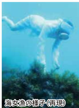
海女漁の様子(再現)

夏泊漁港では近年まで海女漁が行われていました。夏泊漁港の海女漁は、400年以上前、豊臣秀吉の朝鮮出兵に伴い、鹿野城主亀井茲矩の水先案内人を務めた漁師助右衛門の妻が、筑前の国から伝えたとされています。夏泊の海女漁が最も盛んだったのは1950年代で、30人程度の集団でワカメなどを採っていました。収穫したワカメは「しぼりワカメ」と呼ばれる伝統の方法で加工されていました。