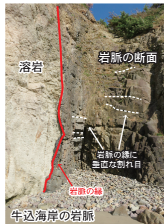
柱状節理…冷却面に対して垂直にできる 岩脈の縁 冷却面に対して垂直にできた割れ目